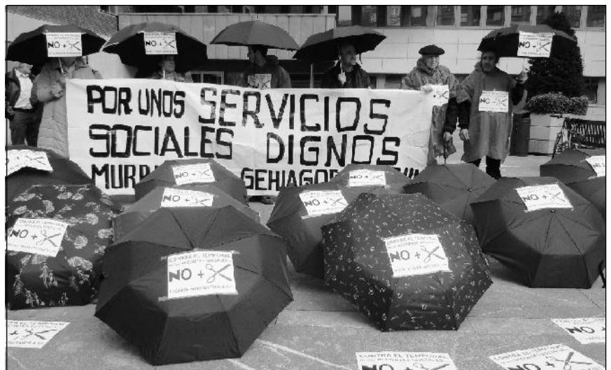
Chubasqueros y paraguas contra el temporal de recortes sociales

-Limitar los recursos para los gastos derivados de la atención sanitaria no cubierta por Osakidetza o para formación e inserción laboral.