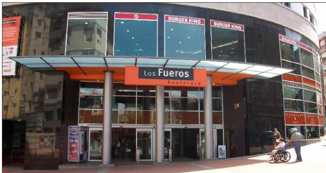
Los Fuegos Boulevard

El Tribunal Superior de Justicia del País Vasco ha ordenado al Ayuntamiento que proceda a inscribir en el Registro de la Propiedad que el plan urbanístico que permitió el edificio del centro comercial Los Fuegos Boulevard es nulo, según estableció mediante sentencia el Tribunal