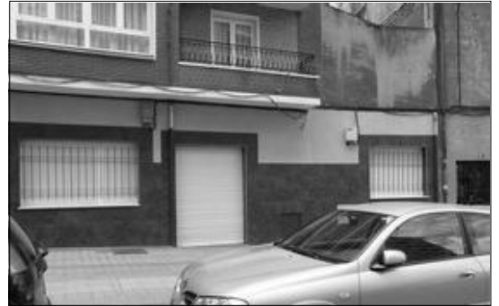
Comedor social de Cáritas.

El Banco de Alimentos de Ezkerraldea repartió 200 toneladas de alimentos el año pasado.