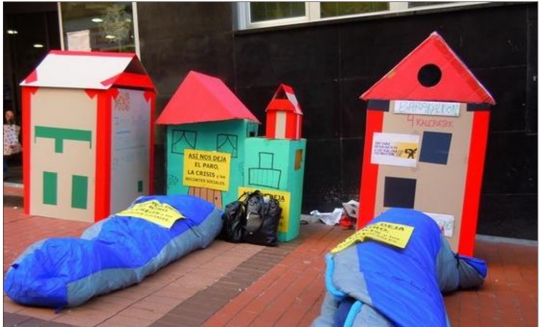
Reciente protesta contra los desahucios en Barakaldo.

En concreto, 54 familias fueron desalojadas de sus casas entre enero y marzo; 59 entre abril y junio; 37 entre julio y septiembre; y, finalmente, 53 entre octubre y diciembre del 2011. En total, 4 familias de Barakaldo son desahuciadas a la semana de sus viviendas.