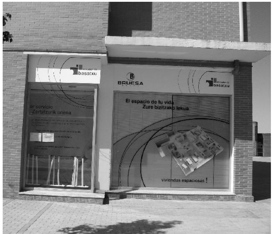
Oficina de la constructora Bruesa en Barakaldo

Las casas en un principio destinadas al realojo de estas 5 familias fueron adjudicadas en última instancia a familiares directos de políticos del Equipo de Gobierno del Ayuntamiento. Así, se